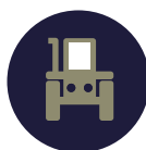
La mobilité Terrestre Ground mobility