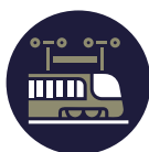
L'industrie Ferroviaire Railway industry