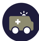
Le secteur Médical Medical sector